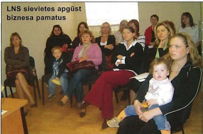
LNS sievietes apgūst biznesa pamatus