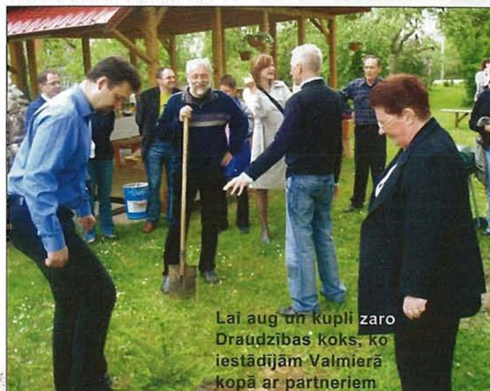
Lai aug un kupli zaro Draudzības koks, ko iestādījām Valmierā kopā ar partneriem