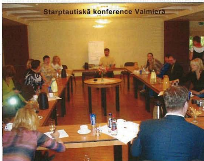
Starptautiskā konference Valmierā