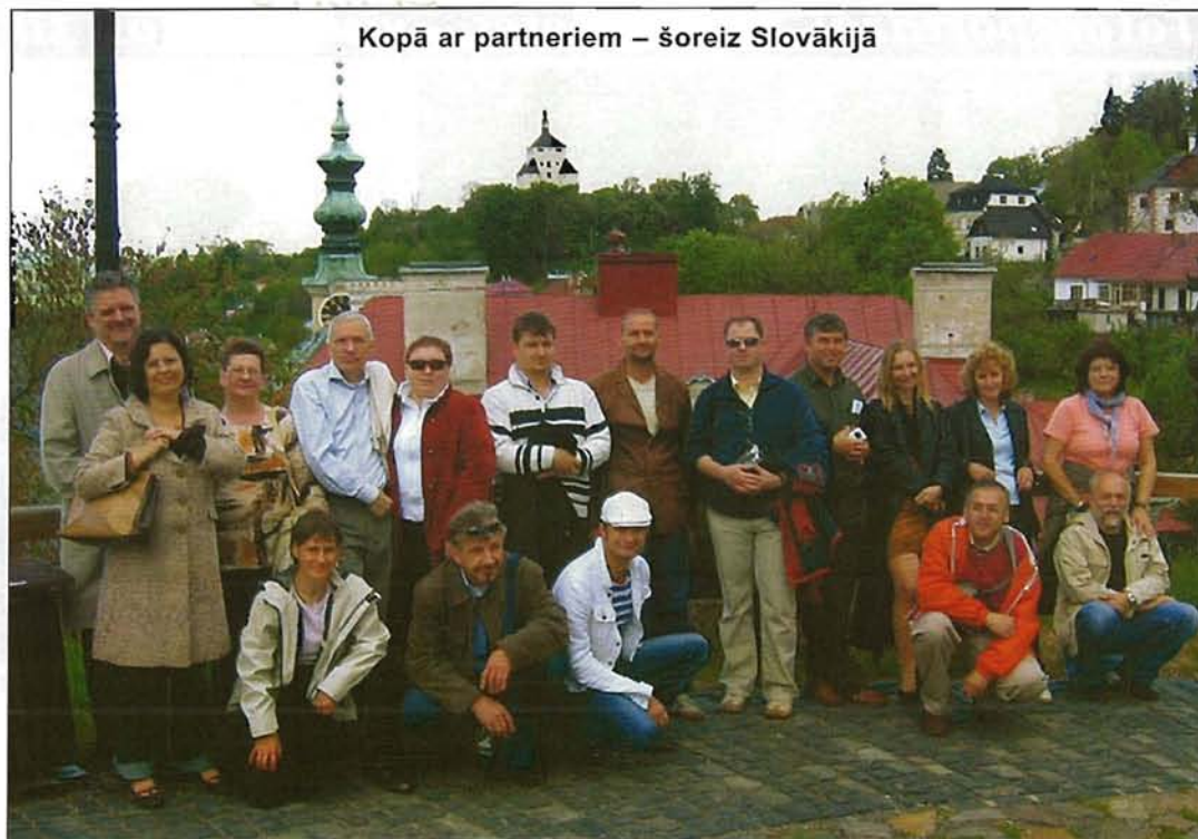
Kopā ar partneriem – šoreiz Slovākijā

Bijām uz UNESCO vēsturiskajām vietām. Mūku klosterī iepazīnāmies ar mūku ikdienas dzīvi. Jāatzīst, klosteris ir mūsdienīgs, jo mūkiem ir iespēja pa TV sekot pasaules čempionātam hokejā, ir arī savs sporta laukumiņš. Izstāigājām nacionālo parku un kādu mazu pilsētiņu. Apmeklē-