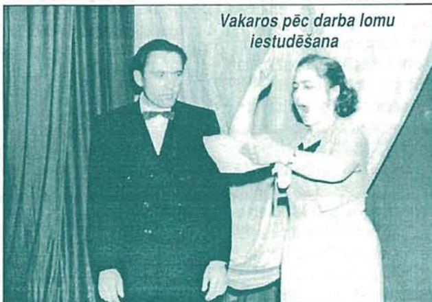
Vakaros pēc darba lomu iestudēšana

1953. gadā beidzu vidusskolu ar kvalifikāciju tehniķe — modeliste. Vajadzēja iet strādāt tur, kur norīkoja, — uz Rīgu, uz šūšanas ateljē universālveikala «Centrs» augšējā stāvā. Gribējās palikt Latgalē, tuvāk pie dzimtajām mājām. Tomēr ar