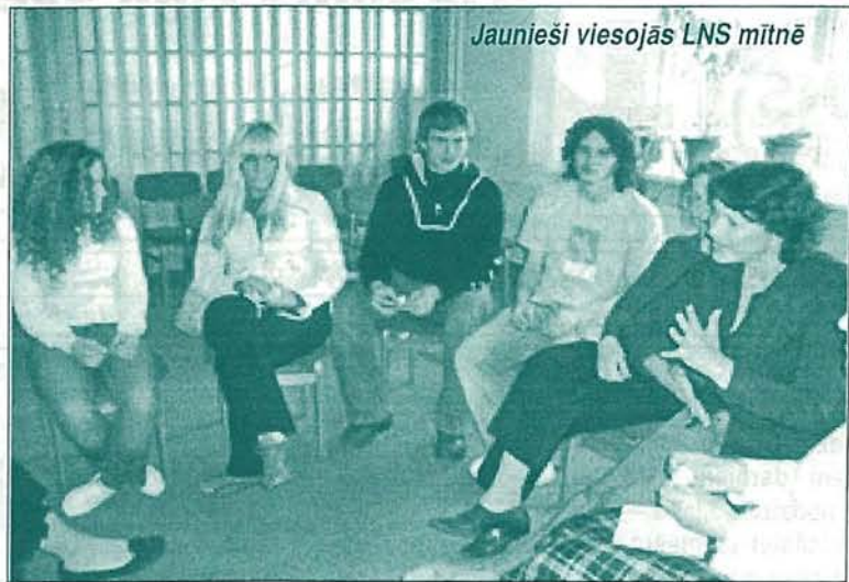
Jaunieši viesojās LNS mītnē