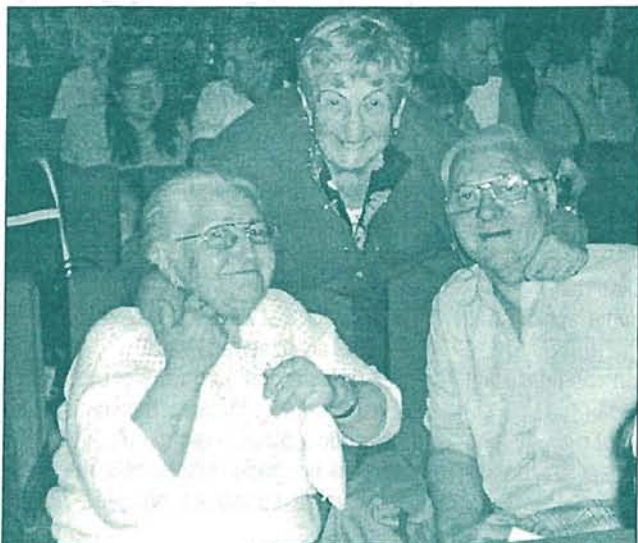
Kopā ar draugiem festivālā Rēzeknē – 2007. VI

Divdesmit gadus sekoju, lai visi kārtīgi maksātu biedru naudu, kā arī apciemoju nespēcīgākos biedrus. Vienam otram nespēcīgākam biedram palīdzēju pasūtīt vai piegādāt