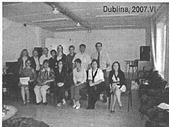
Dublina, 2007. VI

Projekta koordinators bija SIA «Salò Baltic International», kas pateicas LNS par sadarbību, un esam gatavi sadarboties arī turpmāk. Projekta partneri bija Viļņas Nedzirdīgo Rehabilitācijas centrs, Tallinas Nedzirdīgo bērnu vecāku asociācija, Slovā-