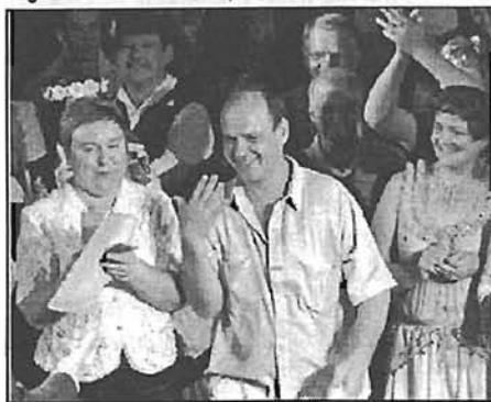
Laimīgais noslēgums: LNS himna izskanējusi. Visi apmierināti.

Cilvēki ir! Arī iesaistījušos cilvēku skaits aptuveni līdzīgs kā agrāk. Arī jaunieši nāk. Ir jauniešu deju kolektīvs «Rītausmā», arī biedrībās viņi darbojas diezgan aktīvi, ja vien viņus ieinteresē un uztur šo interesi, aicina uz mēģinājumiem, atgādina... Lielākā problēma varētu būt