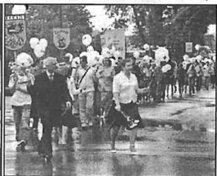
Uz Māras pieminekli!