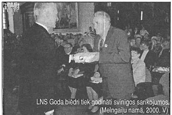
LNS Goda biedri tiek godināti svinīgos sarīkojumos (Melngailu namā, 2000. V)

No bērnības mani pievelk maksšķerēšana — gan ziemā, gan vasarā. Tagad gan jau retāk to daru, nav vairs tās varēšanas, kas agrāk. Daudz lasu grāmatas, avīzes, žurnālus, skatos TV. Pārvaldu latviešu, poļu, krievu valodu, par zīmju valodu nerunājos. Kad ir iespē-