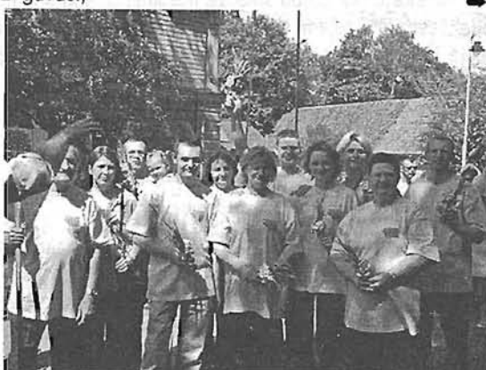
Pa kreisi: Kas var saskaitīt liepājnieku izdejos soļus divos gados? Šeit — festivālā 2006.