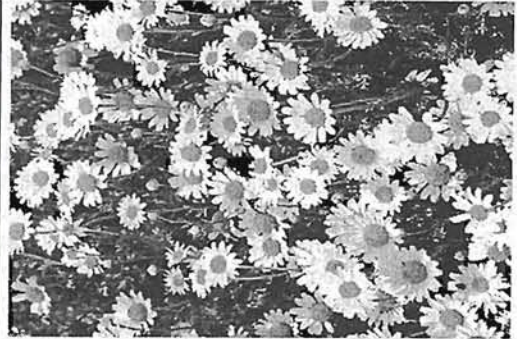
Tautas ticējums vēstī: Ja lietus ielīs Septiņu gulētāju dienā (šogad 13. jūlijā), tad līs vēl 7 nedēļas. Jauku vasaru!