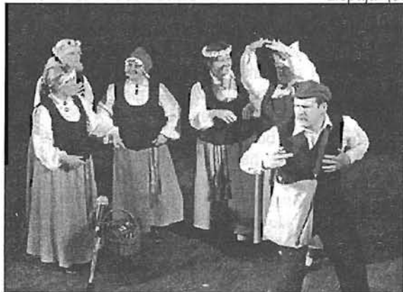
Pa labi: valmierieši vienmēr kopā — tikuši līdz sešdesmitgadei.

Īpaši daudz paveikts, realizējot 4 projektus, pildot sadarbības līgumus ar Valmieras pilsētas un rajona pašvaldībām. Veiksmīga sadarbība ir arī ar SK «Tālava». Pašdarbība tiek aktivizēta īpašos gadījumos, kad jāpiedalās LNS