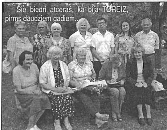
Šie biedri atceras, kā bija TOREIZ, pirms daudziem gadiem...

Vēstures fakti liecina, ka Valmieras nodaļas dibināšana oficiāli notikusi 1947. gadā, kaut arī gana sarežģīts bijis ceļš uz šo statusu.