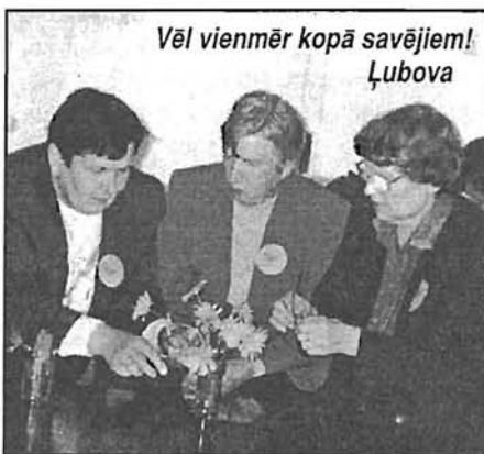
Vēl vienmēr kopā savējiem! Lūbova

«Viss turpinās, tikai savādāk... Šodien visur vajag naudu, arī jaunie bez naudas nav iekustināmi,» tā Lūbova secina un atzīst: