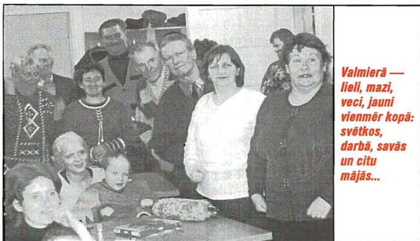
Valmierā — lieli, mazi, veci, jauni vienmēr kopā: svētkos, darbā, savās un citu mājās...

Tiešām nesaprotu, kāpēc LNS pēkšņi vairs nevar vadīt dzirdīgs cilvēks, ja viņš prot zīmju valodu, nācis no nedzirdīgo ģimenes utt.