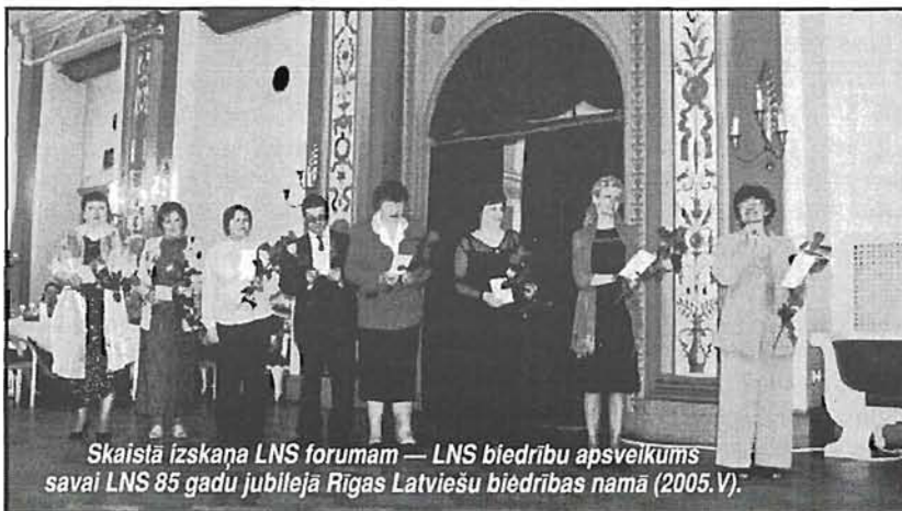
Skaidra izskaņa LNS forumam — LNS biedrību apsveikums savai LNS 85 gadu jubilejā Rīgas Latviešu biedrības namā (2005. V).

Mēs nevaram sevi salīdzināt ar tām ES valstīm, kur pavisam cits dzīves un izglītības līmenis, cita vēsture un pieredze.