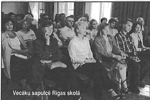
Vecāku sapulcē Rīgas skolā

Pieteikties SMS apziņošanas sistēmai Rīgas nedzirdīgo bērnu internātpamatskolas bērnu vecāki var aizpildot iesnieguma veidlapu, kuru var saņemt pie klases audzinātājiem. Informāciju par projektu un tā ieviešanas gaitu skolās ikviens var izlasīt speciāli šim projektam izveidotā mājas lapā http://www.e-klase.lv