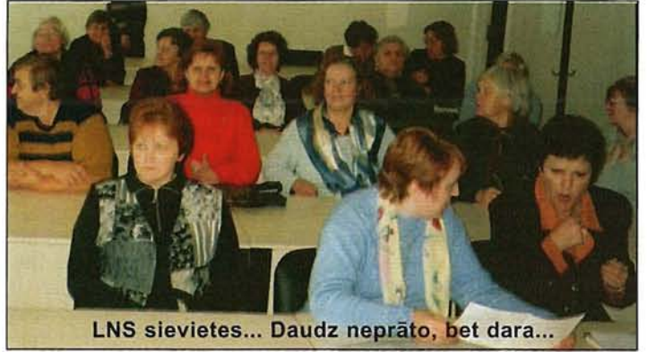
LNS sievietes... Daudz neprāto, bet dara...