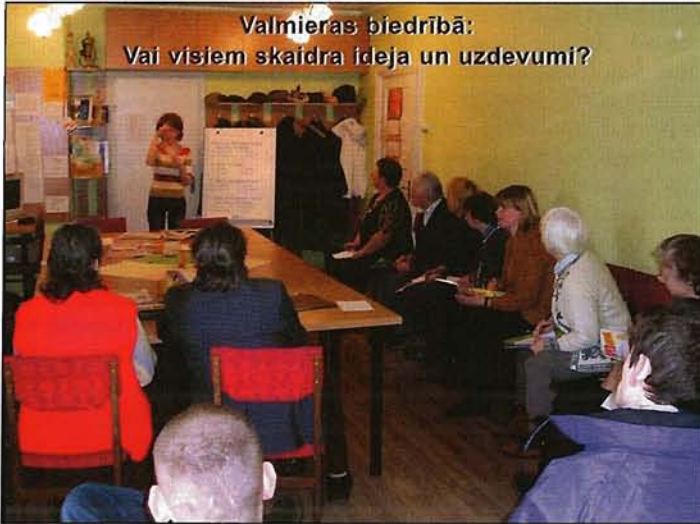
Valmieras biedrībā: Vai visiem skaidra ideja un uzdevumi?

Kā ziņojām, vasarā notika iekļaušanās pasākumu un pilotprojekta grupu brīvprātīgo apmācība — ieviešanas nometnes Jūrmalā, Sabiedrības integrācijas centra mācību centrā. Četrās nometnēs tika apmācīti pie četrdesmit brīvprātīgie. Tagad viņi iegūtās zināšanas izmanto praktiski, jo sākusies trīs pilotprojekta realizācija.