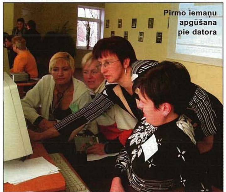
Pirmo iemaņu apgūšana pie datora

Samērā sarežģīti izrādījās izveidot savu e-pastu un strādāt ar to, tomēr apmācību noslēgumā visas dalībnieces tika pie e-pasta adreses un nosūtīja pirmās vēstules. Ļoti daudz pozitīvu emociju izraisīja pašrocīgi