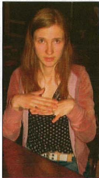
I. Immures foto

Pirmā darba vieta Edītei varēja būt kāda kafējnīca Vecrīgā, kur viņa strādāja prakses laikā. Kolektīvs viņu ļoti uzņēma un piedāvāja tūlīt uzsākt darbu pēc prakses. Diemžēl RRC skolotāja neatļāva viņai strādāt, baidoties, vai viņa spēs darbu apvienot ar