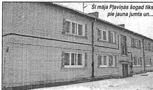
Šī māja Pļaviņās šogad tiks pie jauna jumta un...

Lūdzam Jūsu izpratni un pacietību, līdz nodrošināsim citas iespējas avīzes savlaicīgai tehniskai sagatavošanai.