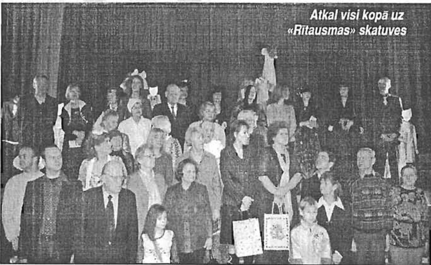
Atkal visi kopā uz «Rītausmas» skatuves

Šo mīlestību viņa centās ieaudzināt arī mums. Režisore izaudzināja daudzus aktierus, visus nav iespējams nosaukt, pieminēšu spožākās turpinājums 8.lpp