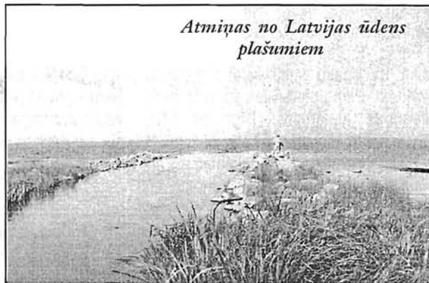
Atmiņas no Latvijas ūdens plašumiem