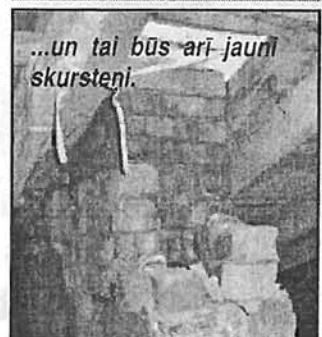
...un tai būs arī jauni skursteņi.