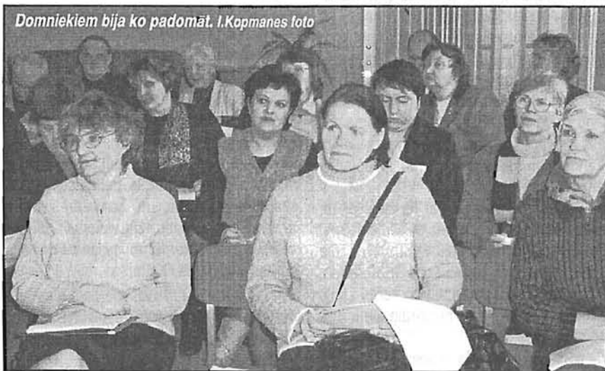
Domniekiem bija ko padomāt.

Materiāli sagatavoti ar ES finansiālu atbalstu. Par to saturu pilnībā atbild Latvijas Nedzirdīgo savienība, un tie nekādā ziņā neatspoguļo ES viedokli.