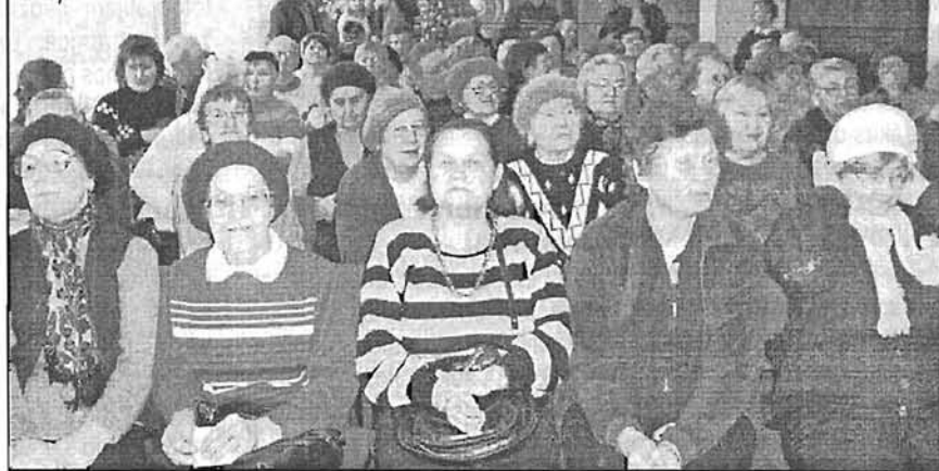
Mūsu ļaudis.