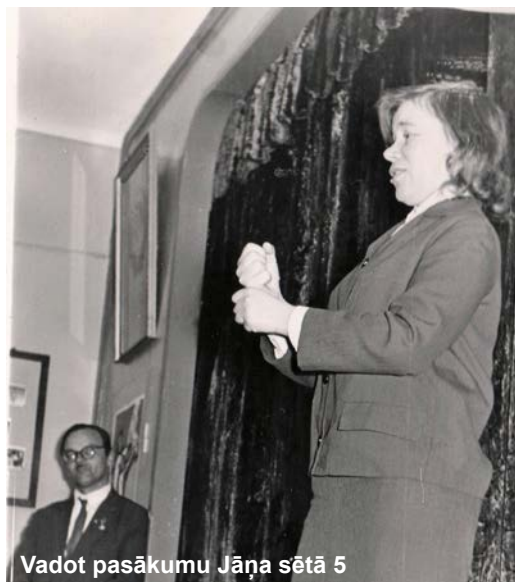
Vadot pasākumu Jāņa sētā 5

Vairāk foto varat apskatīties LNS mājaslapas sadaļā “Foto galerijas”