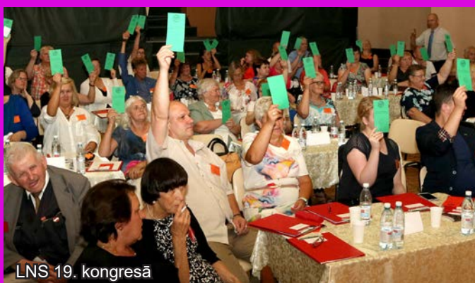
LNS 19. kongresā