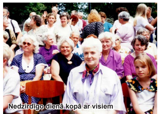
Nedzirdīgo dienā kopā ar visiem