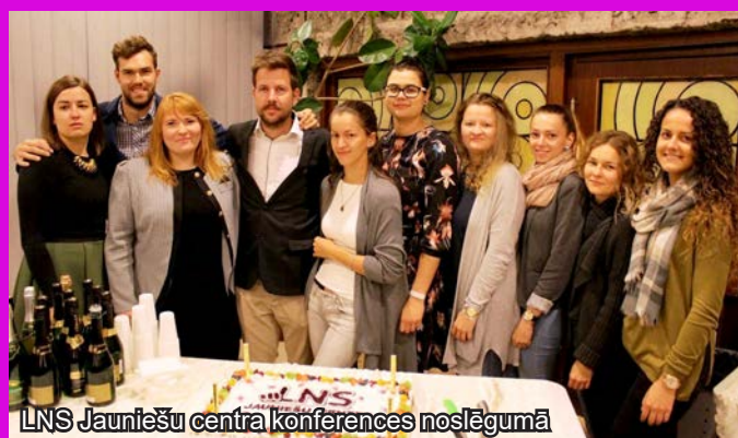
LNS Jauniešu centra konferences noslēgumā