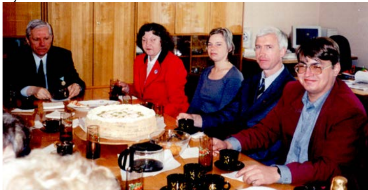
"Dzintras laikā" ar viņas piegādātajām tortēm mīlojušies daudzi...