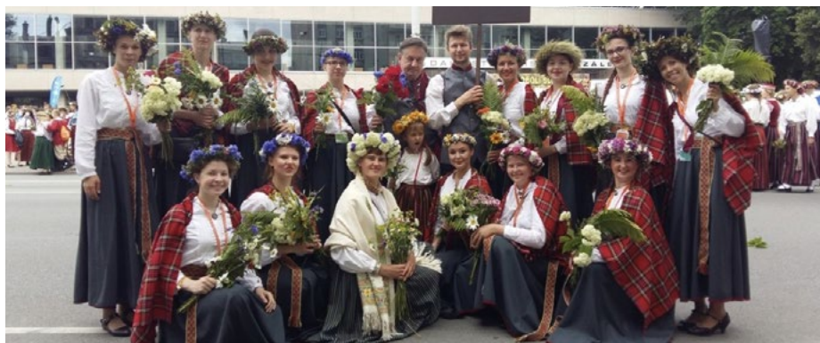
XI Latvijas Skolu jaunatnes dziesmu un deju svētku gājiens, 2015. gads