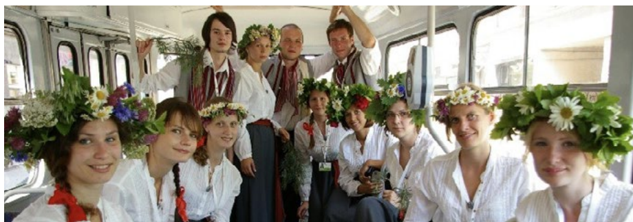
Ceļā uz X Latvijas Skolu jaunatnes dziesmu un deju svētkiem, 2010. gads