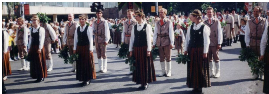
XXI Vispārējie latviešu Dziesmu un XI Deju svētki, 1993. gads