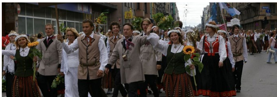
XXIV Vispārējie latviešu Dziesmu un XIV Deju svētku gājiens, 2008. gads