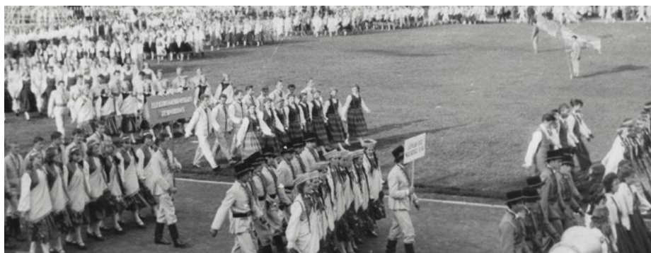
XIV Vispārējie latviešu Dziesmu un deju svētki, 1965. gads

Jaunieši ar dzirdes traucējumiem piedalījās arī 2010. un 2015. gada Latvijas Skolu jaunatnes dziesmu un deju svētku pasākumos. Diemžēl iespēju piedalīties skolēnu svētkos 2020. gadā neļāva Covid-19 infekcijas izplatība. •