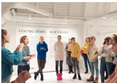
LATVIJAS BANKAS SIMTGADES IZSTĀDE "VĒRTĪBU ZĪMES"