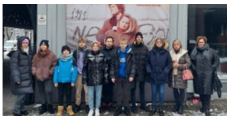
VIESTURA KAIRIŠA FILMA "JANVĀRIS"