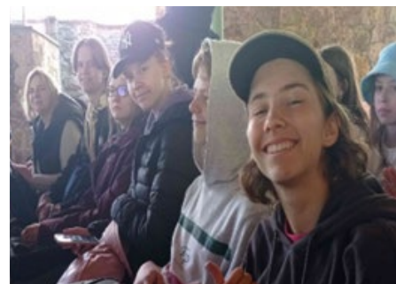
MŪZIKA TEV, LIELKONCERTS "TUVU BŪT", DZINTARU KONCERTZĀLE