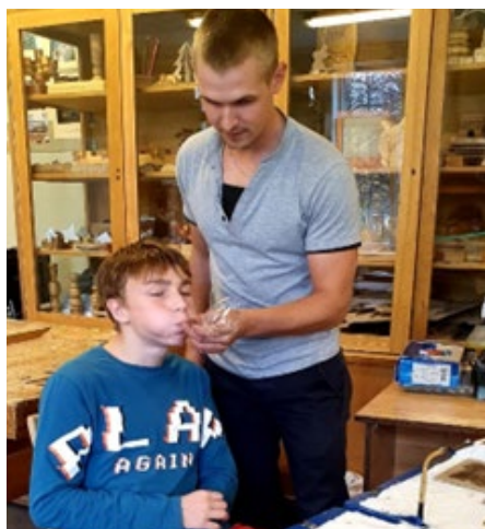
VENTSPILS STIKLA PLASTIKAS MEISTARI - STIKLA FIGŪRIŅU VEIDOŠANAS MEISTARKLASE