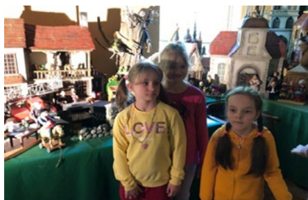
KINOLEKTORIJS "IEPAZĪSTIES - LEĻĻU KINO!"