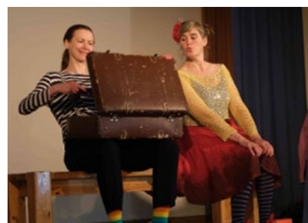
IZRĀDE AR ŽONGLĒŠANAS ELEMENTIEM "SOLIŅŠ"

Rīgas Ēbelmuižas pamatskolā 2023. gada 31. maijā norisinājās Pēdējais zvans.