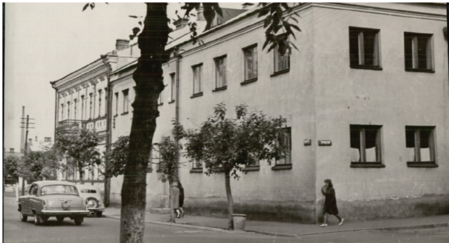
Daugavpils kluba ēka 60.–70. gados

Uz svētkiem mūsu klubā bieži atbrauca biedri no Līvāniem, Krāsla-