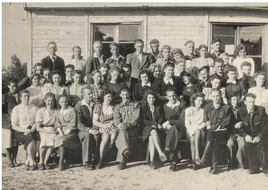
Daugavpils biedrības pirmā kopsapulce