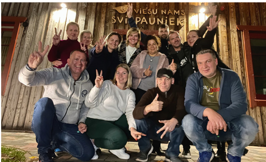
Tukuma biedri sajūsmā par viesu namu “Svilpauņieki”