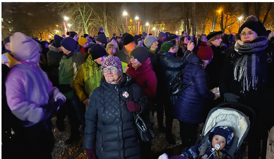
Liepājnieki svin Latvijas Republikas svētkus