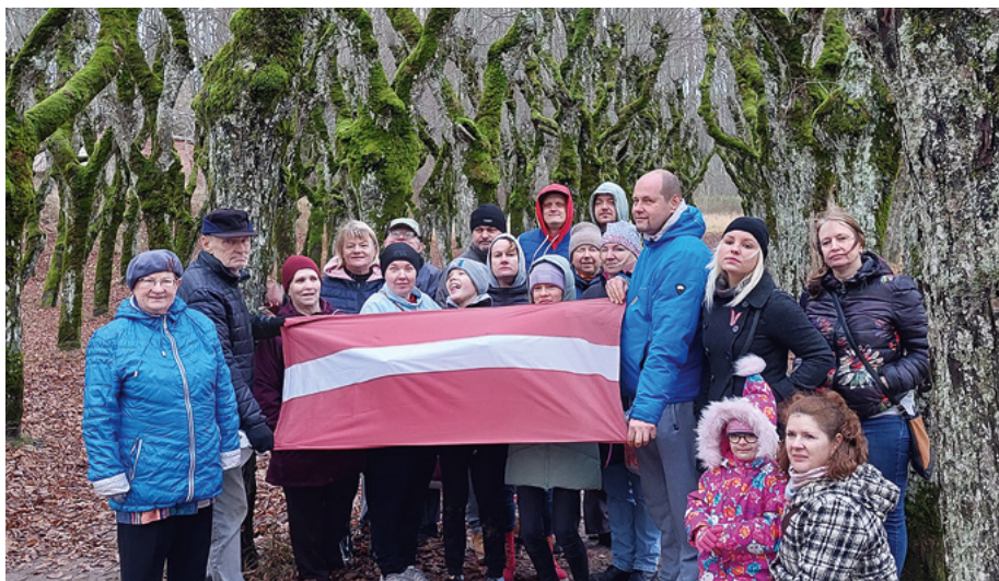
Patriotiskie valmierieši mistiskajā Katvaru liepu alejā

dus vīnus un lika minēt, no kā katrs darināts."