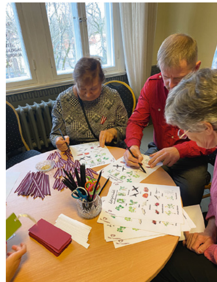
Kuldīgas biedri valsts svētkos liek puzzle un pārbauda savas zināšanas par valsts simboliem