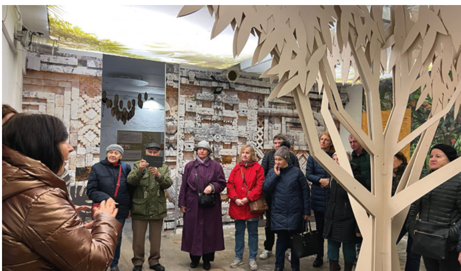
Rīgas biedri Pūres šokolādes muzejā

un ogām tiek gatavots vīns. Vīnotavā varējām degustēt dažādas vīnu šķirnes un bija iespēja nopirkt vīnu.