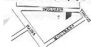
Zemesgabala izvietojums kvartālā (Liepājā)