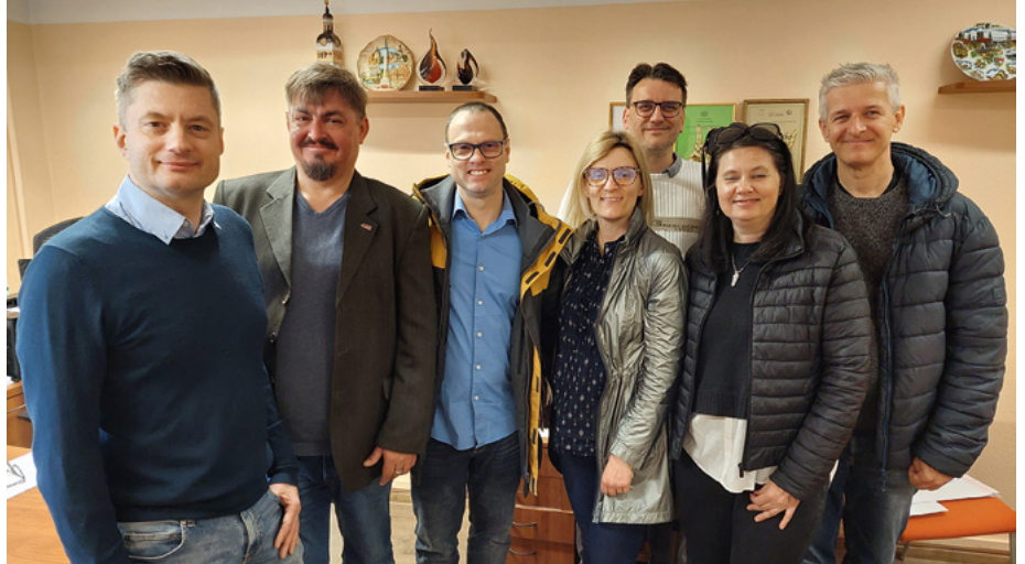
Slovēņu nedzirdīgo delegācija tikās ar LNS vadību

No 26. līdz 31. aprīlim Latvijas Nedzirdīgo savienību (LNS) apmeklēja Slovēnijas Nedzirdīgo asociācijas "14 11" biedri, lai izzinātu LNS pieredzi nedzirdīgo cilvēku interešu pārstāvībā. Viņi tikās ar LNS vadību, iepazīs ar Rehabilitācijas centra un Surdotehniskās palīdzības centra sniegtajiem pakalpojumiem. Slovēnijas nedzirdīgo delegācija apmeklēja arī dienas centru "Rītausma", LNS muzeju, Liepājas Nedzirdīgo biedrību un Rīgas Ēbelmuižas pamatskolu. Viesi tikās arī ar Rīgas RB biedriem – prezentēja savu valsti, vēsturi un kultūru, pastāstīja par savu organizāciju, dalījās pieredzē un atbildēja uz interesentu jautājumiem.