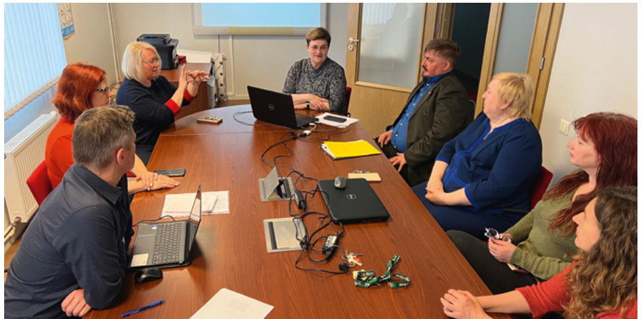
Tikšanās par latviešu zīmju valodas korpusu

Vēl valde pieņēma zināšanai informāciju par LNS biedru statistiku par