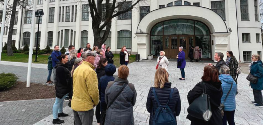
Rīgas RB Vidzemes grupa devās ekskursijā uz kultūras pili "Ziemeļblāzma"