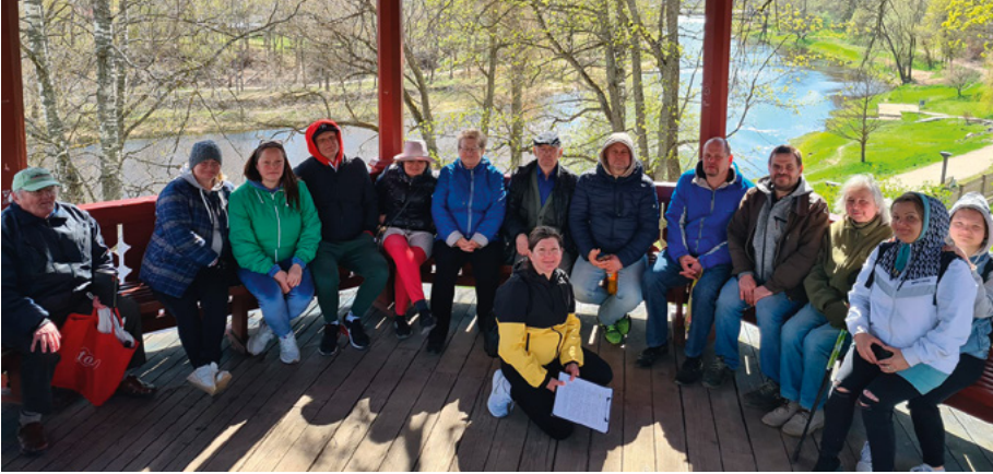
Valmieras RB biedri iepazīna savu apkārtni