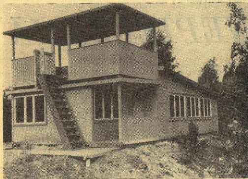
Atpūtas nometnes centrā uz pakalna paceļas jaunā sarkanā stūrīša ēka.

Septembra pēdējo svētdienu visa pasaulē atzīmē kā Starptautisko nedzirdīgo dienu. Šai dienā daudzi Rīgas un rajonu nedzirdīgie pulcējās biedrības atpūtas pilsētiņā Dzirnuragā, kur notika vairāki sarīkojumi. Svētku priekšvakarā — 24. septembrī, atklāja jauno atpūtas nometnes sarkano stūrīti. Ši stāltā ēka, kas paceļas atpūtas nometnes vidū, uz pakalna, uzcelta pašu spēkiem.