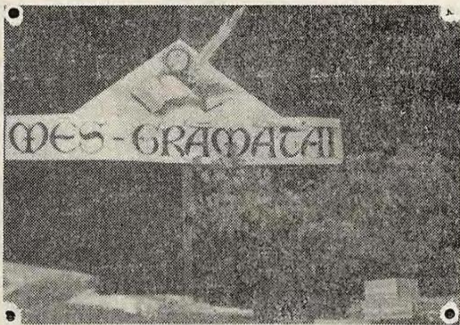
Foto ainiņas no kultūras namā «Rītausma» redzētā tvēra VALDIS KRAUKLIS

Kungs ar grāmatu komplektu: Es parasti neko nelaimēju un arī