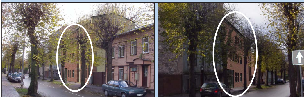
Liepājā māja 1905. gada ielā būs izvietota starp jau divām esošām ēkām.

Tiesa, gribētos lielāku skatuvi, bet ir labi, ka būs visas nepieciešamās darba un palīgtelpas mūsu biedru apkalpošanai sociālās rehabilitācijas jomā. Tātad ēka jau drīz vien tiks uzcelta, bet mums, liepājniekiem, būs jāprot paveikt pašu galveno – mājai radīt dvēseli. Mēs to izdarīsim, lai tikai būtu pati māja!"▲