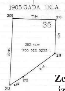
Zemesgabala plāns Liepājā