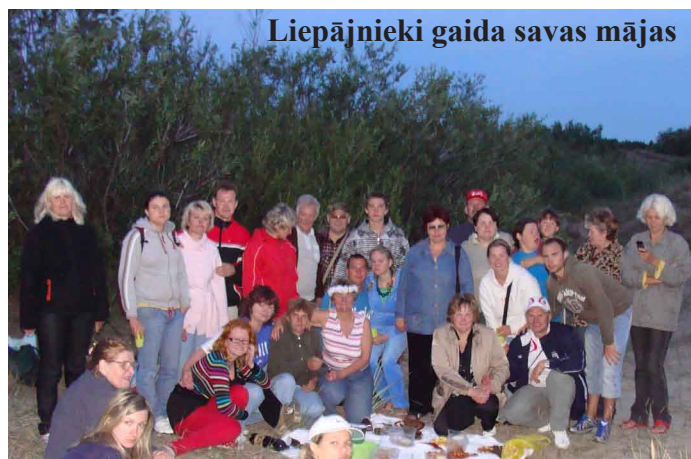
Liepājnieki gaida savas mājas

Visus gaidīsim ar sālsmaizi mūsu jaunajās mājās, teiksim, pēc pāris gadiem. Bet pagaidām gan