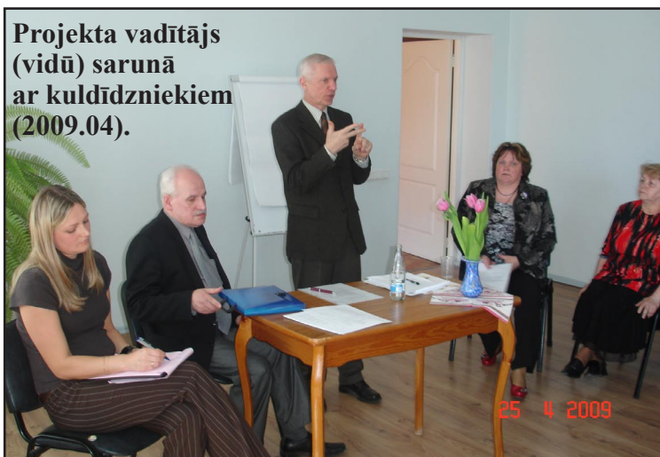
Projekta vadītājs (vidū) sarunā ar kuldīdzniekiem (2009.04).

☐ LNS jaunā projekta nosaukumā ietverts visai plašu jēdzienu spektrs. Lūdzu, paraksturojiet tos! Sāksim ar „XXI gadsimts. Nedzirdība...” Liekas, šādu tēmu aplūkosim pirmoreiz. Vai nedzirdība šajā gadsimtā ieguvusi jaunas aprises un tā tad ir parādība, kas laika gaitā pārveidojas?