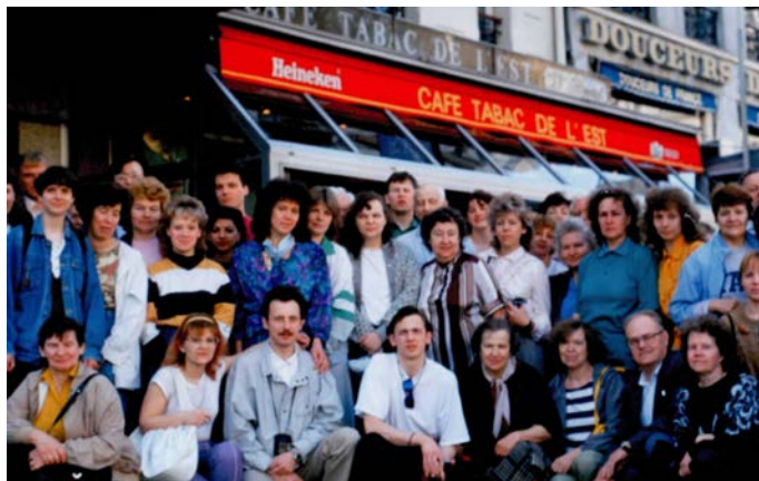
Pirmā "KS" noorganizētā tūristu grupa Parīzē – 1995

Daudzi tūkstoši grāmatu ar KS logo atraduši ceļu pie lasītājiem (1996 – 2008)