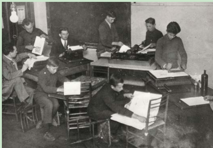
Skolēni drukā "Mūsu Žurnālu" (1925) Valmieras Valsts kurlmēmo skolā

“Mūsu Žurnāls” (1925–1927), drukāts tipogrāfijā; “Mūsu Avīze” (1927–1929).