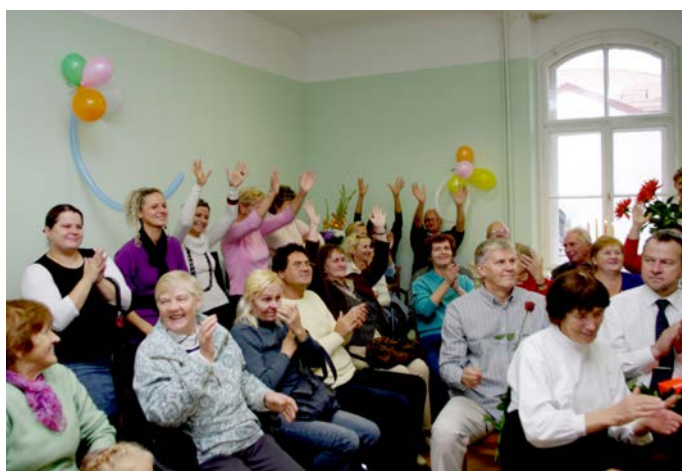
2010. gada 15. septembrī iznācis 1000. numurs!