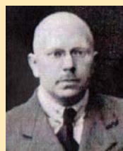
Pirmais redaktors Ernests Ulmanis (1930 – 1933)