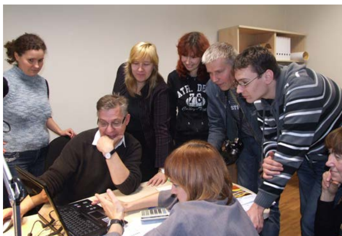
Pieredzes apmaiņā Igaunijas Nedzirdīgo biedrībā (2009)