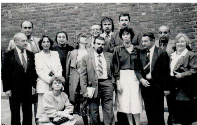
Starptautisks nedzirdīgo izdevumu redaktoru seminārs (Baltijas un citas PSRS republikas, Polija, Bulgārija – 1989)