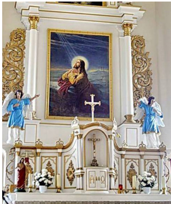
Mākslinieces veidotie divu eņģeļu tēli centrālā altāra sānos Rubeņu katoļu baznīcā.

Sagatavoja: Ilze Kopmane