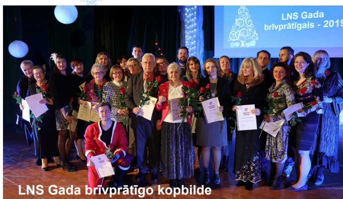
LNS Gada brīvprātīgo kopbilde