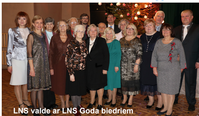
LNS valde ar LNS Gada biedriem