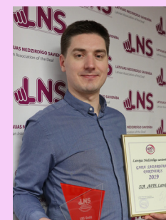
LNS Gada sadarbības partneris 2019 – SIA "Bite Latvija"