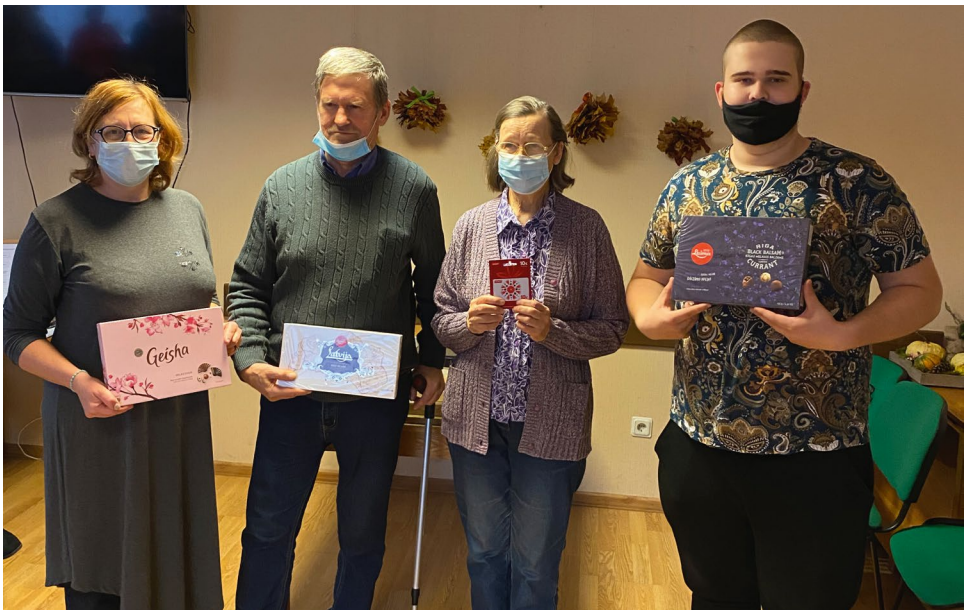
Kuldīgas RB prāta spēļu konkursa uzvarētāji