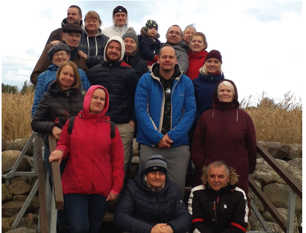
Valmierieši bauda rudeni Ainažos

Paldies biedrības tulcei Taigai Puķjānei, kas pēc biedru vēlmēm izveidoja ekskursijas maršrutu!