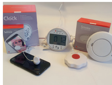
Dūmu detektors un mobilā telefona zvana detektors