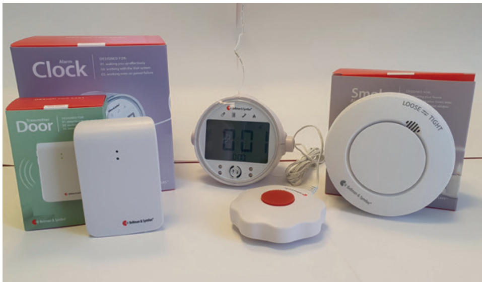
Dūmu detektors un domofona zvana detektors