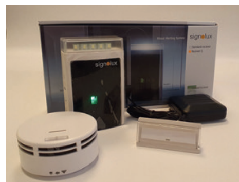
Dūmu detektors un durvju zvana detektors

Lai to saņemtu, ir jāuzraksta iesniegums un jāiesniedz ārsta atziņums par tehniskā palīgīdzekļa nepieciešamību. ●